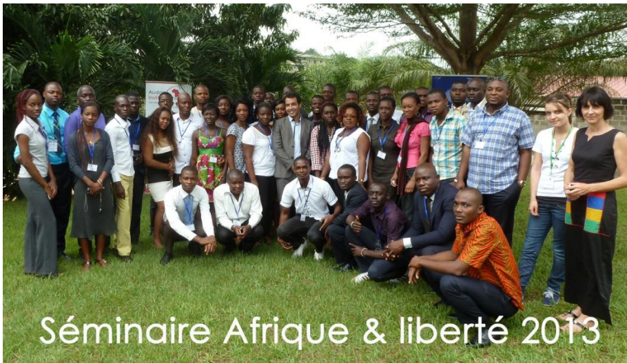
Séminaire Afrique & liberté 2013